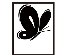
〈ちょうちょ〉 12ミリから対応