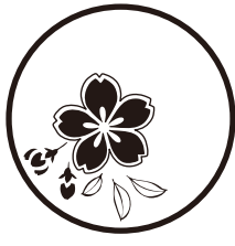
〈桜とはっば〉 15ミリから対応