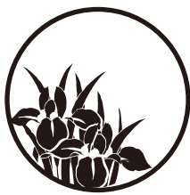
〈かきつばた〉 18ミリのみ対応