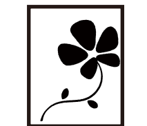
〈小花〉 12ミリから対応