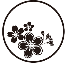
〈桜とつぼみ〉 15ミリから対応