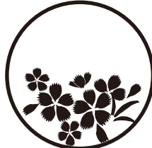
〈なでしこ〉 15ミリから対応