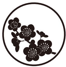
〈うめ〉 18ミリのみ対応