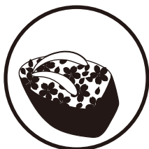
〈京ぽっくり〉 18ミリのみ対応