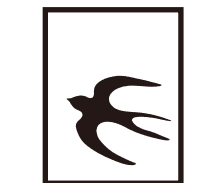
〈つばめ〉 12ミリから対応