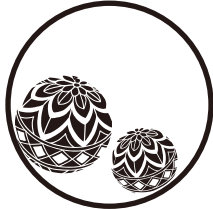
〈まり〉 18ミリのみ対応